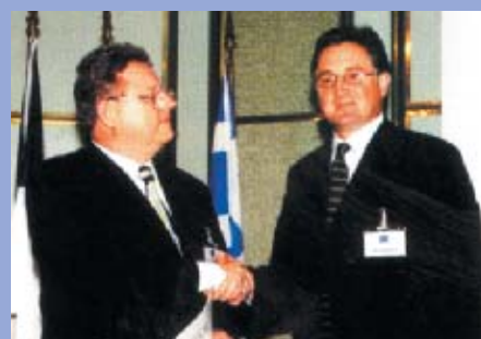
Berlin, Juin 1999