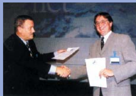
Londres, Septembre 1996