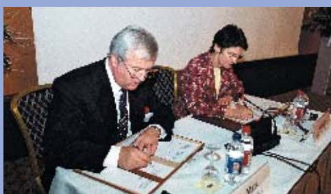
Bruxelles, Décembre 2001

Déclaration conjointe sur la reconnaissance mutuelle entre la CoESS et l'Euro-FIET et sur le dialogue social (10 juin 1999)